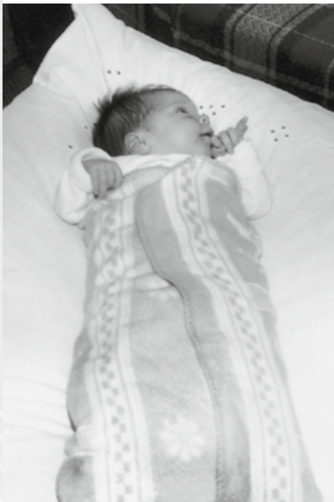
Neuer Erdenbürger, Jahrgang 1960.

erhalten die Briten Franco H. Compton Crick und Maurice F. Wilkins sowie der US-Amerikaner James D. Watson den Medizin-Nobelpreis für ihre bahnbrechenden Forschungen zur Struktur der Desoxyribonukleinsäure (DNS).